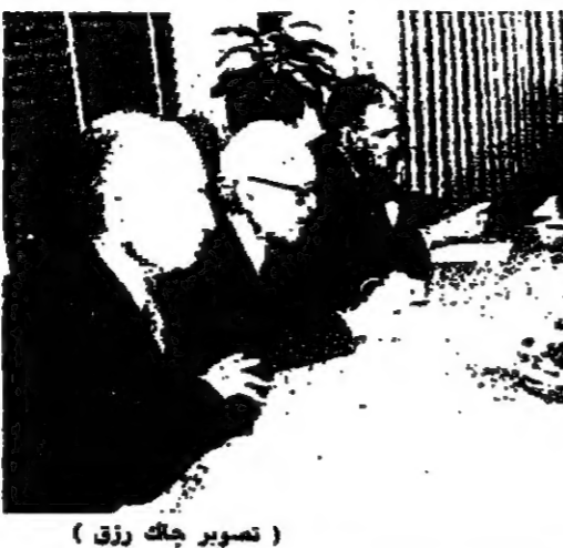
اجتماع الجبهة في الكسليك

سرقات السيارات تتمت تقرير قوى الأمن الداخلي، في ضوء بيان من قبل مسؤولين في الأمانة العامة، أن سرقات السيارات تكثر في بيروت.